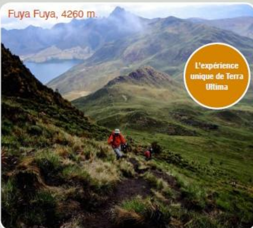
Fuya Fuya, 4260 m.

- Visiter le vieux quartier de Quito, classé Patrimoine Mondial de l'Unesco.